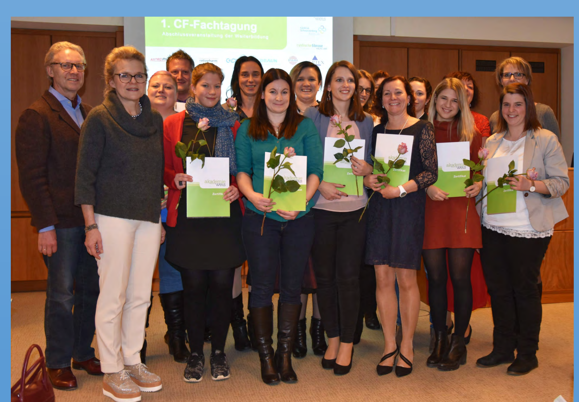
AbsolventInnen und Lehrgansleitung 1 Weiterbildung bei CF in Wels

Die nächste Weiterbildung startet im Januar 2020, Info und Anmeldung sind ab sofort möglich. (begrenzte Teilnehmerzahl) markus.dalbeck@ks-klinikum.at oder office@akademiewels.at www.akademiewels.at/cf-lehrgang-2020